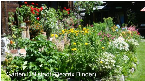
Garten Hallstatt (Beatrix Binder)