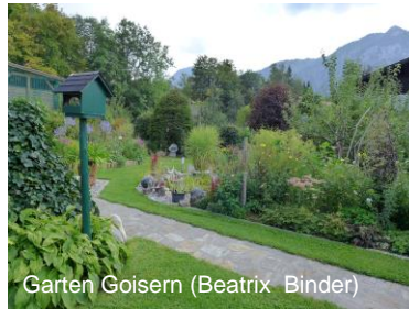
Garten Goisern (Beatrix Binder)

Heute Morgen erwartet Frau Binder Sie wieder. Erste Station ist ein privates Gartenparadies eines Ehepaars in Goisern . „ Sinn für Ästhetik “: das 2.300 m 2 große Areal birgt viele interessante Entdeckungen. Da ist zum